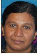
Poetry Award Aazhiyaal கவிதை விருது ஆழியாள் நெடுமரங்களாய் வாழ்தல்